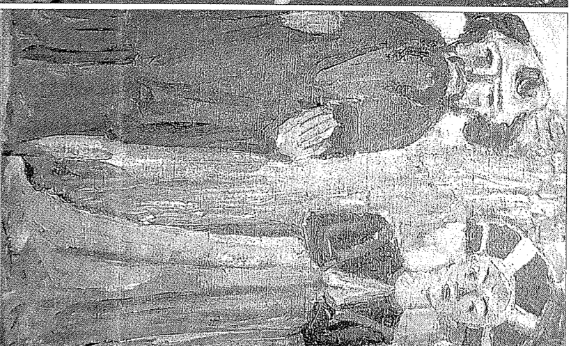
Zurück in Neumünster: links die Keramik „Zwei Tänzerinnen“ von Emil Nolde aus dem Jahr 1913, rechts sein Gemälde „Kirchentuguen“ (ebenfalls 1913).