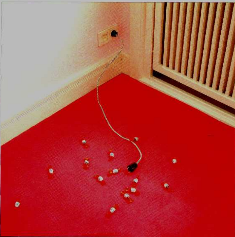
CARSTEN HÖLLER, Hard, Hard to be a Baby, Kinderschaukel, 1992/2011. Herbert Gerisch Stiftung 2011.

Jenes Spiel mit dem Spiel, mit Verführung und Enttäuschung zieht sich seit 20 Jahren wie ein roter Faden durch das Werk Carsten Höllers. Der 1961 in Brüssel geborene Künstler studierte in Kiel Agrarwissenschaften, wurde 1993 am Institut für Phytopathologie über Parasiten habilitiert. Doch da war er längst schon zum Shootingstar der Kunstszene geworden, stellte später auf der Venedig-Biennale aus, auf der documenta sein „Haus der Schweine“, große Rutschen in der Tate Modern Galerie und unlängst seine lebenden Rentiere im