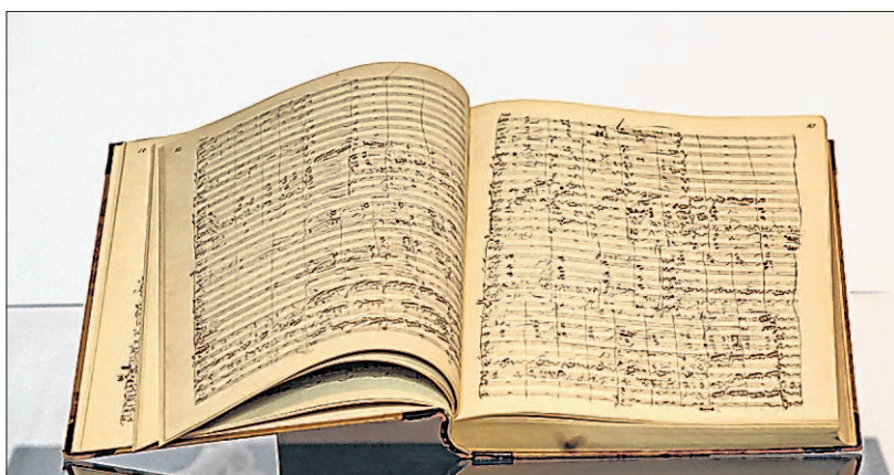
Der heilige Hort aus dem Besitz Thomas Manns: das „Tristan“-Faksimile von 1923, entliehen vom Thomas-Mann-Archiv der Eidgenössischen Technischen Hochschule Zürich.