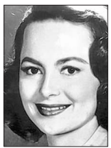
Olivia de Havilland 1939

Im vergangenen Herbst wurde sie auch in ihrer Wahlheimat Frankreich gewürdigt, wo sie seit den 1950er Jahren lebt. Der österreichische Theatermann Max Reinhardt hatte sie 19-jährig für die Rolle der Hermia in Shakespeares „Sommernachtstraum“ entdeckt. Das Filmstudio Warner Brothers nahm Olivia de Havilland gleich für sieben Jahre unter Vertrag.